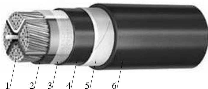
Fig.2 Părți componente a LEC-0,4 kV

Pentru cablu de putere de joasă tensiune, 0,4 kV.